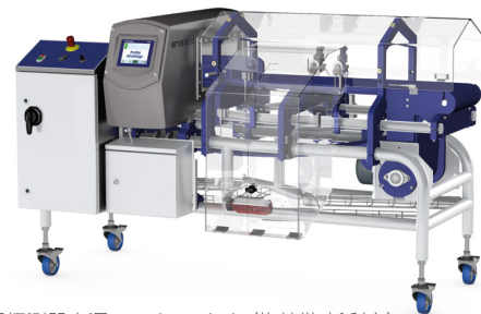
金属探测器